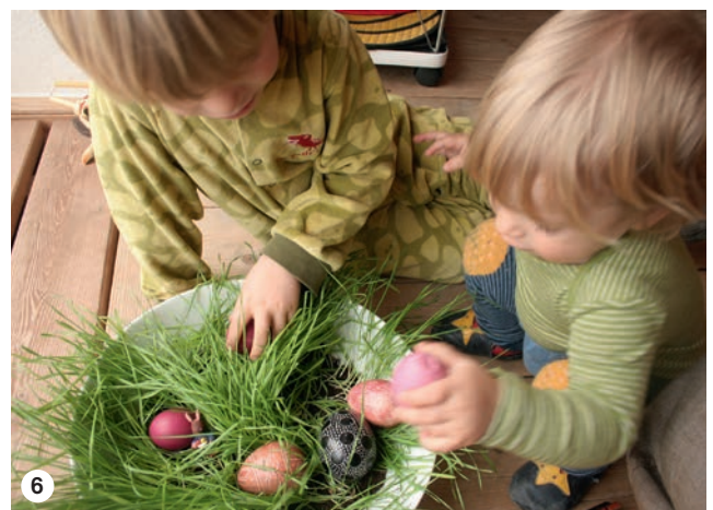
6 ... das Ostereier-Finden macht trotzdem Spaß.