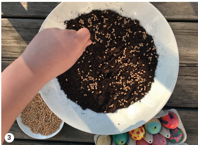
3 Die Samen dicht aussäen.