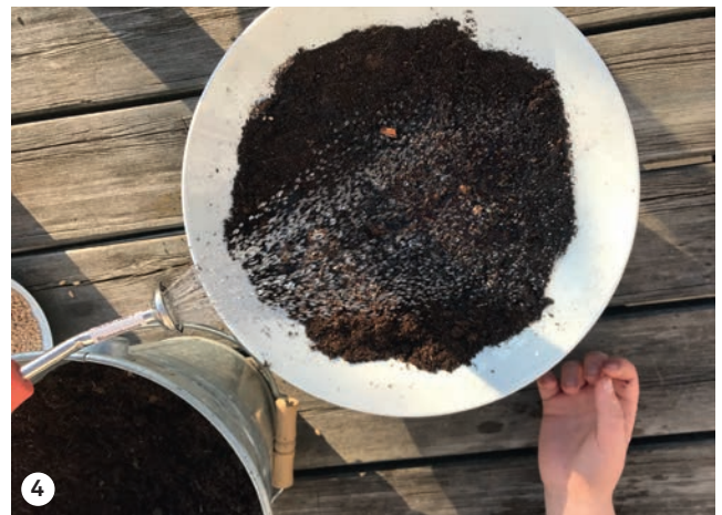
4 Etwas Erde drüber, andrücken und gießen. Dann warm (am Fensterbrett indoor aufstellen) und feucht halten.