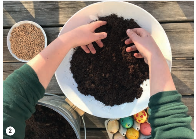
2 In die Schüssel ca. 5 cm hoch Erde füllen.