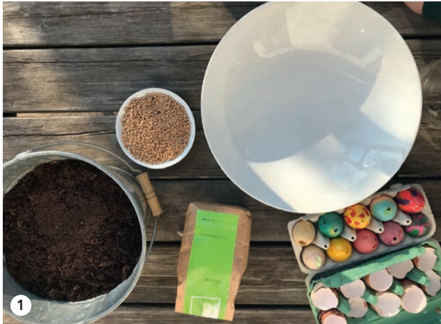
1 Die Zutaten: Frischer Weizen (oder Gerste), eine große Schüssel, Erde und Ostereier.